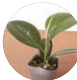
フィカスエラスティカ