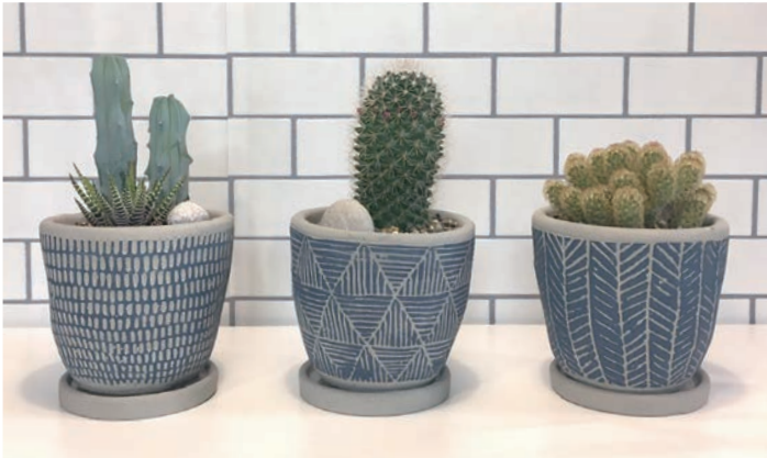
8S68BL レリーフプランター サボテン BLUE 各 ¥3,000 (税抜) LOT 6 CTN 6 φ 125 h120 内寸: φ 105 h95 皿: φ 100 h15 穴あり皿付き 素材: セメント