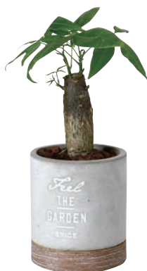
HAK20037 セメントプランター 観葉植込み ラウンド ¥2,400(税抜) LOT 8 CTN 8 φ110 h125 内寸: φ90 h95 素材: 本体・受け皿: セメント