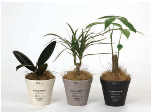
HAK20033 BENIGN サステイナブル エコポット観葉投げ込み Sサイズ 各 ¥1,500 (税抜) LOT 15 CTN 15 φ 110 h95