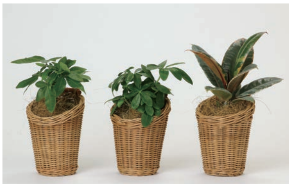
HAK20045 MERRY バスケット アクアテラポット 10.5 ¥2,500(税抜) LOT 12 CTN 12 φ115 h160 素材: プランターカバー: ラタン

ラタンのミニバスケットに、底面給水の観葉植物(アクアテラポット)をセットしてお届け。 ナチュラルな優しい雰囲気。植物の指定はご遠慮ください。