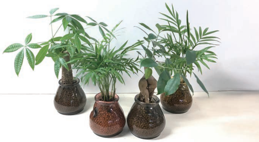
HAK20021 VALENCIA リサイクルガラス CERO 植え込み 各¥1,800 (税抜) LOT 12 CTN 12 φ 100 h95 素材: リサイクルガラス