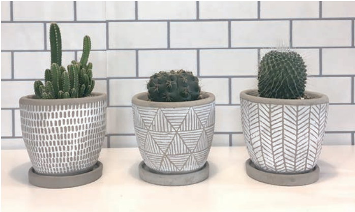
8S68WH レリーフプランター サボテン WHITE 各 ¥3,000 (税抜) LOT 6 CTN 6 φ 125 h120 内寸: φ 105 h95 皿: φ 100 h15 穴あり皿付き 素材: セメント