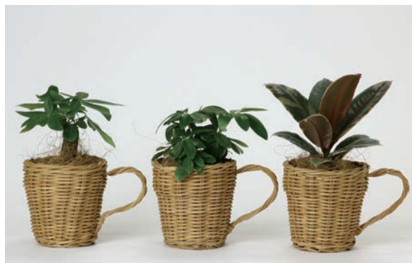
HAK20047 MERRY バスケットカップ アクアテラポット 10.5 ¥2,500(税抜) LOT 12 CTN 12 w180 d120 h120 素材: プランターカバー: ラタン