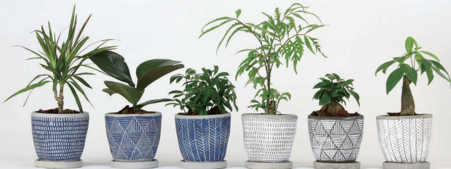
HAK18013 レリーフプランター 朴観葉植え込み 各¥2,400 (税抜) LOT 8 CTN 8 φ 125 h120 穴あり皿付き