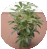
シェフレラホンコン