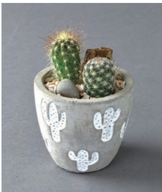
8S46 サボテンプランター サボテン植え込み ¥1,500 (税抜) LOT 8 CTN 24 φ 75 h100 穴あり皿なし