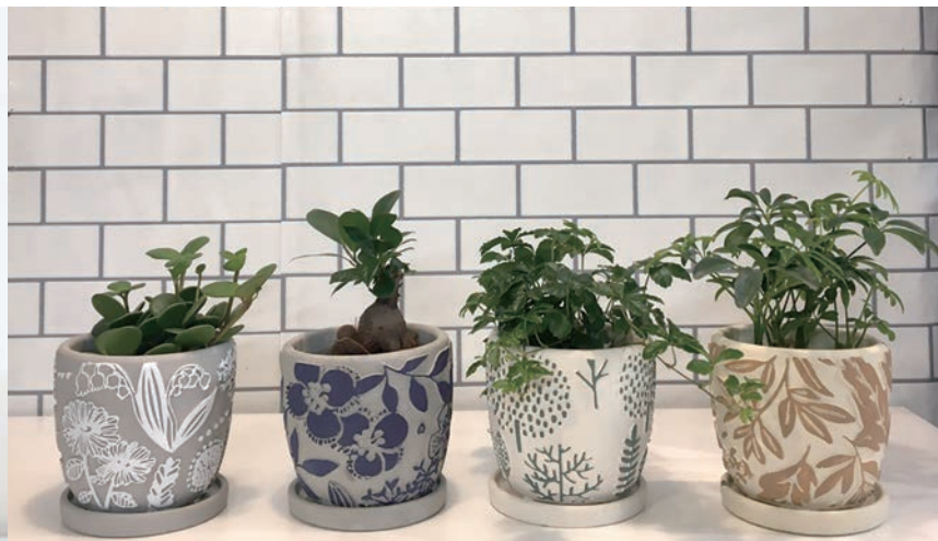
HAK20003 レリーフプランター 植え込み 北欧 各¥2,400 (税抜) LOT 8 CTN 8 φ 125 120 内寸: φ 105 h95 皿: φ 100 h15 穴あり皿付き 素材: セメント