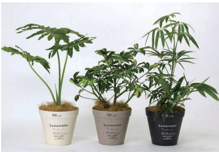
HAK20035 BENIGN サステイナブル エコポット観葉投げ込み Lサイズ 各 ¥5,900 (税抜) LOT 3 CTN 3 φ 185 h180