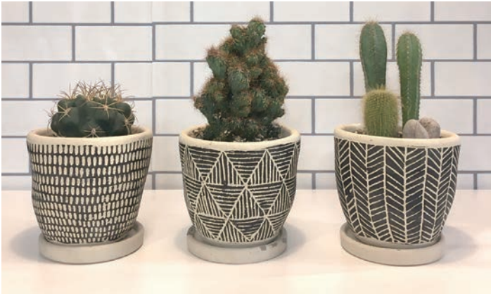
8S68BK レリーフプランター サボテン BLACK 各 ¥3,000 (税抜) LOT 6 CTN 6 φ 125 h120 内寸: φ 105 h95 皿: φ 100 h15 穴あり皿付き 素材: セメント