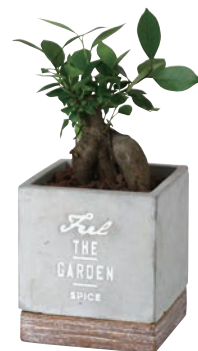
HAK20038 セメントプランター 観葉植込み スクエア ¥2,400(税抜) LOT 8 CTN 8 w110 d110 h125 内寸: w90 d90 h95 素材: 本体・受け皿: セメント