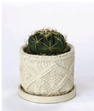
8S73 マクラメプランター サボテン 切り立ち Sサイズ ¥2,400 (税抜) LOT 6 CTN 18 φ 130 h110 穴あり皿付き