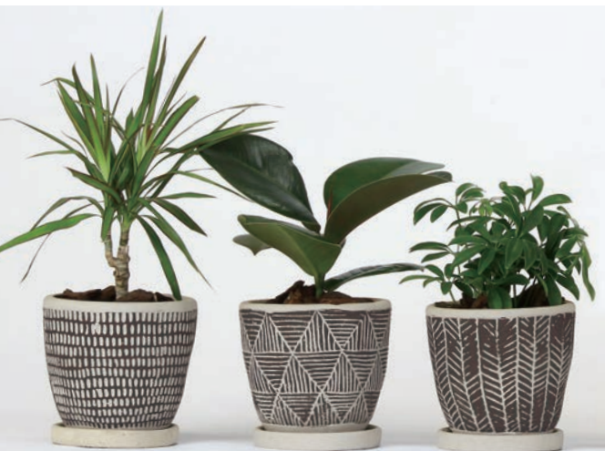
HAK18013BK レリーフプランター 朴観葉植え込み BLACK 各¥2,400 (税抜) LOT 8 CTN 8 φ 125 h120 穴あり皿付き