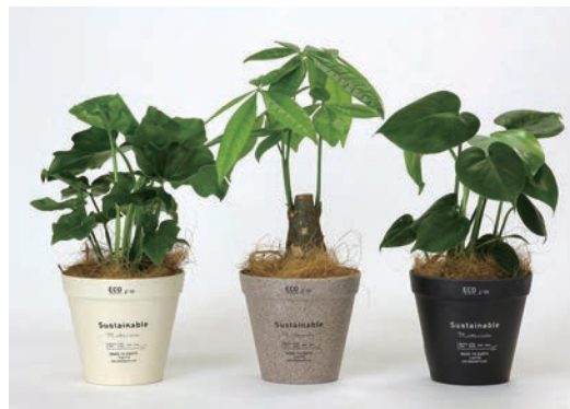
HAK20034 BENIGN サステイナブル エコポット観葉投げ込み Mサイズ 各 ¥2,300 (税抜) LOT 9 CTN 9 φ 150 h135